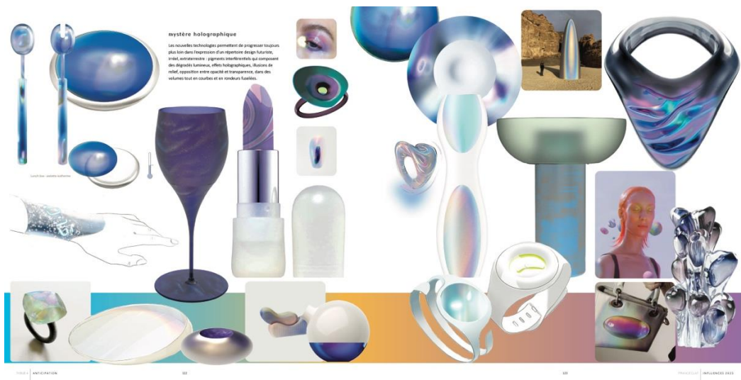
Extrait du thème Anticipation – les visionnaires vertueux

4 - Les visionnaires vertueux nous projettent très en avant dans le thème Anticipation qui met à l’honneur notre capacité d’anticiper au maximum les dangers à venir pour s’en prémunir. Il en ressort un design « solutionniste », qui donne la priorité à une écoconception intransigeante. On navigue ici dans une humeur « under control » qui se déploie sur fond de bleus oxygénés d’optimisme et de neutres apaisants.