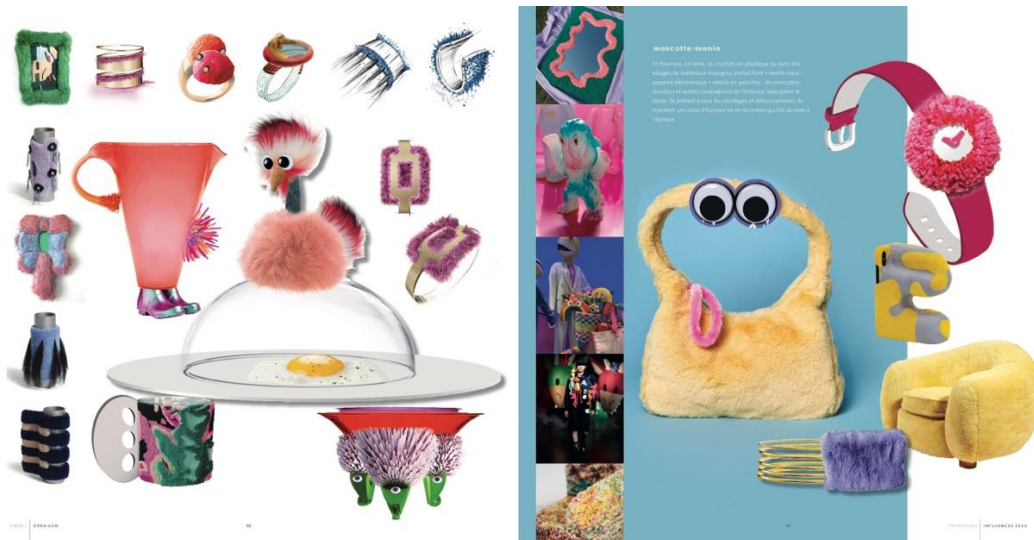
Extrait du thème Déraison - les makers charmeurs

3 - Les makers charmeurs façonnent le thème Déraison : ce troisième thème tourne foncièrement le dos à la morosité. Face à une actualité anxiogène, c’est un esprit déco-bricolo qui surgit et se déploie dans une palette tonitruante associant tonalités vives et pastels régressifs. Comics books, références culte, flash-back nostalgiques – la culture populaire est recyclée et passée à la moulinette de l’inventivité.